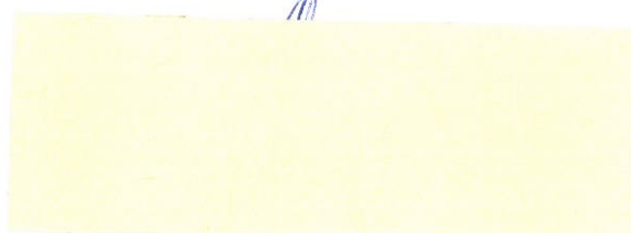
Košice - Európske hlavné mesto kultúry 2013, n.o. Objednávateľ